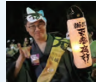
掛川百鬼夜行 2024に参加