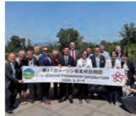
姉妹都市オレゴン州ユージン市へ訪問