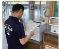
書かない窓口の試験運用を開始