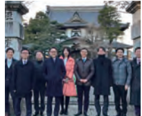
東海若手市長会を掛川市で開催