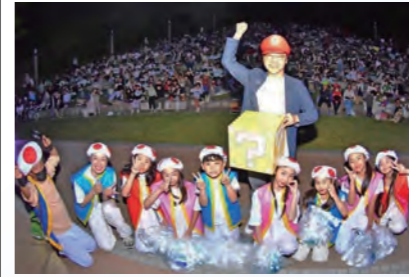
シオーネにて星空映画館が開催