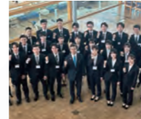
新規採用職員のみなさんおめでとうございます