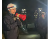
初めての夜間津波避難訓練を実施