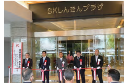
SK しんきんプラザオープニング式典