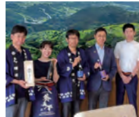
遠州山中酒造「葵天下」仏コンクールで最高賞