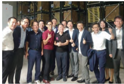
東海若手市長会が多治見市にて開催