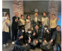
かけがわまちづくりラボ最終回の公開プレゼン