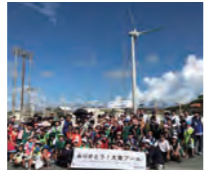
大東プールのお別れセレモニー