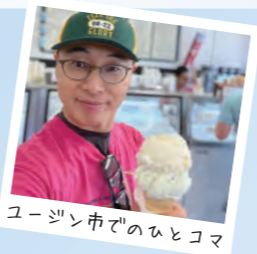
ユージン市でのひとコマ

掛川市に生まれ育ち、国家公務員試験に合格し内閣府の官僚となる。2011年の東日本大震災発生後はボランティア活動をきっかけに岩手県陸前高田市の副市長を頼まれ4年間復興に尽力。退任後は立命館大学教授、掛川市副市長を経て2021年4月に掛川市長に就任。