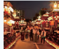
掛川大祭各地区で盛り上がりましたね