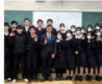
掛川東高校まちづくり提案プレゼンテーション発表会