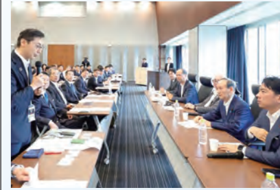
菅元首相、小泉進次郎元環境相にお茶の輸出など要望