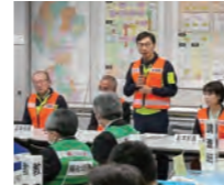
早朝緊急参集訓練