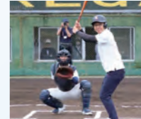
掛川市高校野球交流戦 いこいの広場