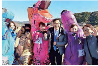
かけがわティラノフェスに参加