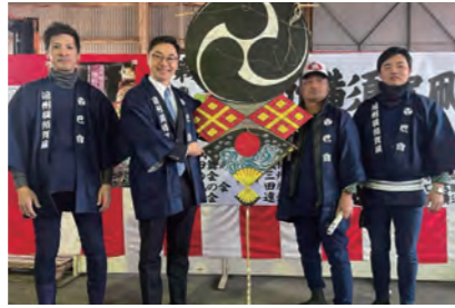
遠州横須賀 凧揚げまつりに参加