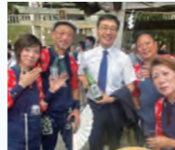
事任八幡宮例大祭の開催おめでとうございます