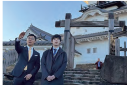
藤井聡太郎将が掛川市にお越しになりました