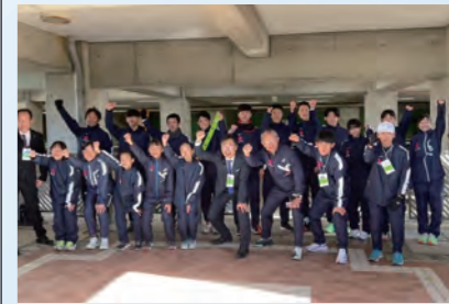
しずおか市町対抗駅伝 6位の過去最高記録