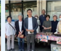
おかみさん市に立ち寄り買い物