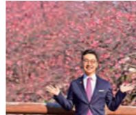
掛川城逆川沿いにて満開の掛川桜と