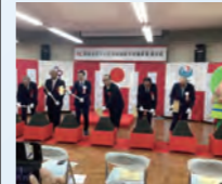
菊川水系下小笠川水位低下対策事業着工式