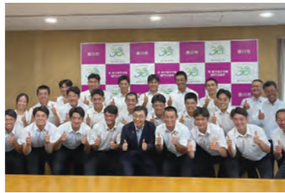
掛西野球部の皆さん甲子園の感動をありがとう