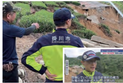
台風10号被災現場を視察 復旧に努めます