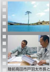
陸前高田市戸羽太市長と